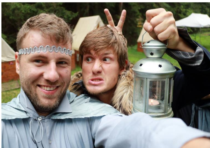
Letní tábor 2017 – Ochránci světla/ Silch a profesor

Na hlídáního psa: každý rodič a každé chytré dítě je hlídací pes. Vyhraje, pokud bude do odjezdu tábora sledovat změny na oddílovém Facebooku ( facebook.com/groups/poutnici.interni ) a hlavně kontrolovat oddílový web s informacemi o táboře ( poutnici.desitka.cz/tabor ).