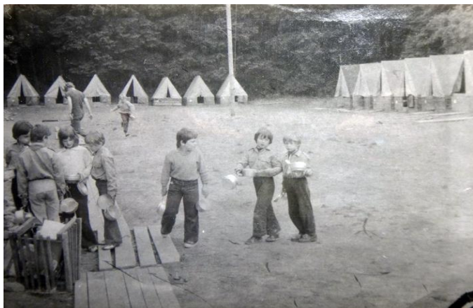
Ubytování je stejné jako v roce 1977. Jen máme nové stany.

K dispozici jsou, tak jak to na pravém táboře musí být , pravé (takže žádná levárna) podsadové stany. Louka, na které tábor stojí, je uprostřed přírody – ze tří stran les, po pár krocích (cca 100 m) vodní hladina Němčické nádrže, kde se v parnu cachtáme (legrační slovo, že?). K dispozici máme dřevěný srub bez elektrické energie (a sakryš!), ve kterém je jídelna, kuchyně, dílna, ošetřovna, dřevník i koupelna s teplou vodou, když nejsme trumbery a chce se nám natahat dřevo na ohřev vody . Nejbližší civilizací je 2,5 km vzdálená vesnice Keblov, však sem tam k nám jezdí z civilizace návštěvy, které jsou pro celý tábor atrakcí (například bobkocucák).